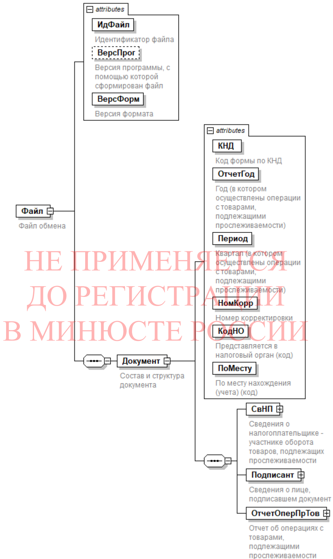
Рисунок 1. Диаграмма структуры файла обмена