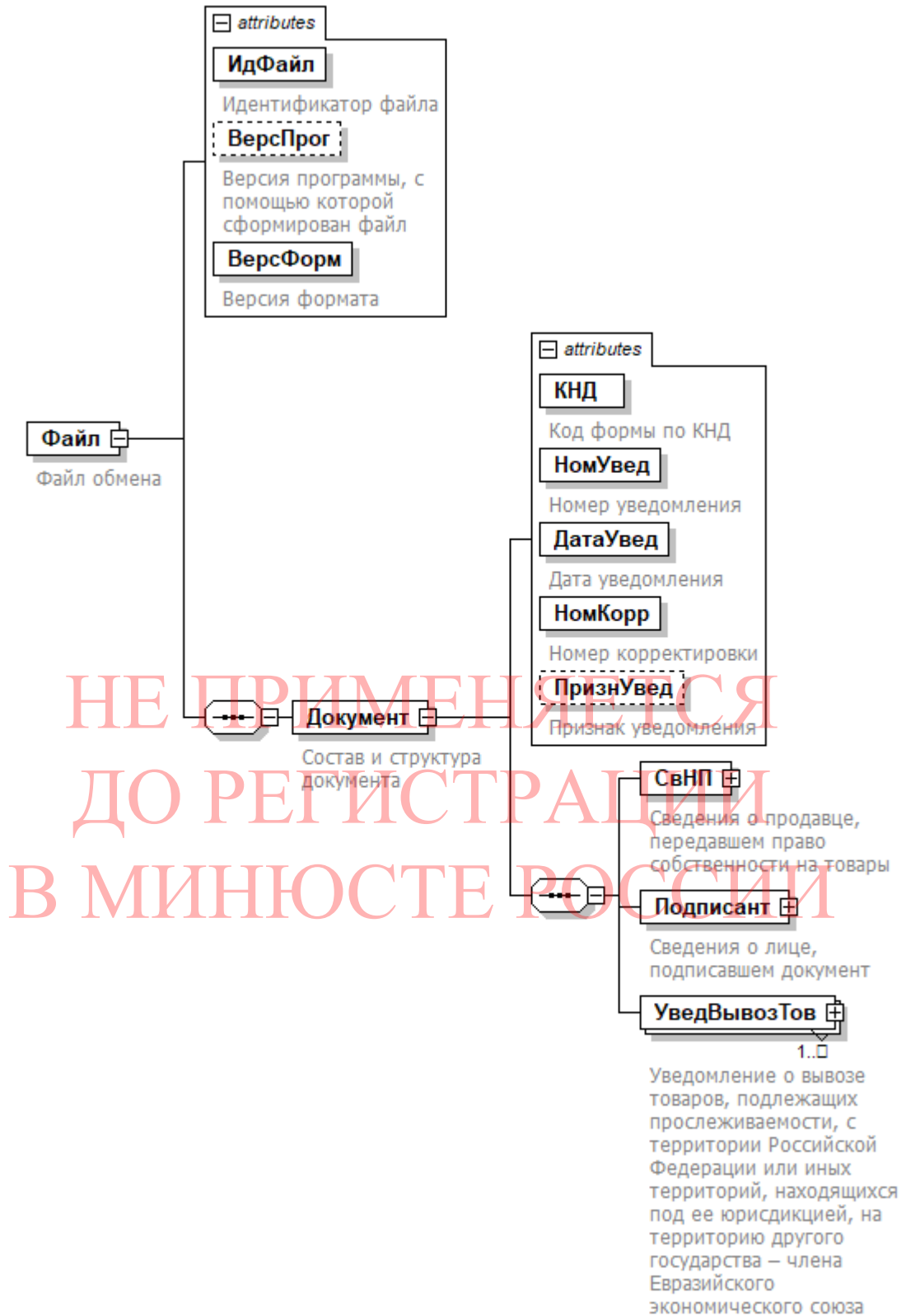
Рисунок 1. Диаграмма структуры файла обмена