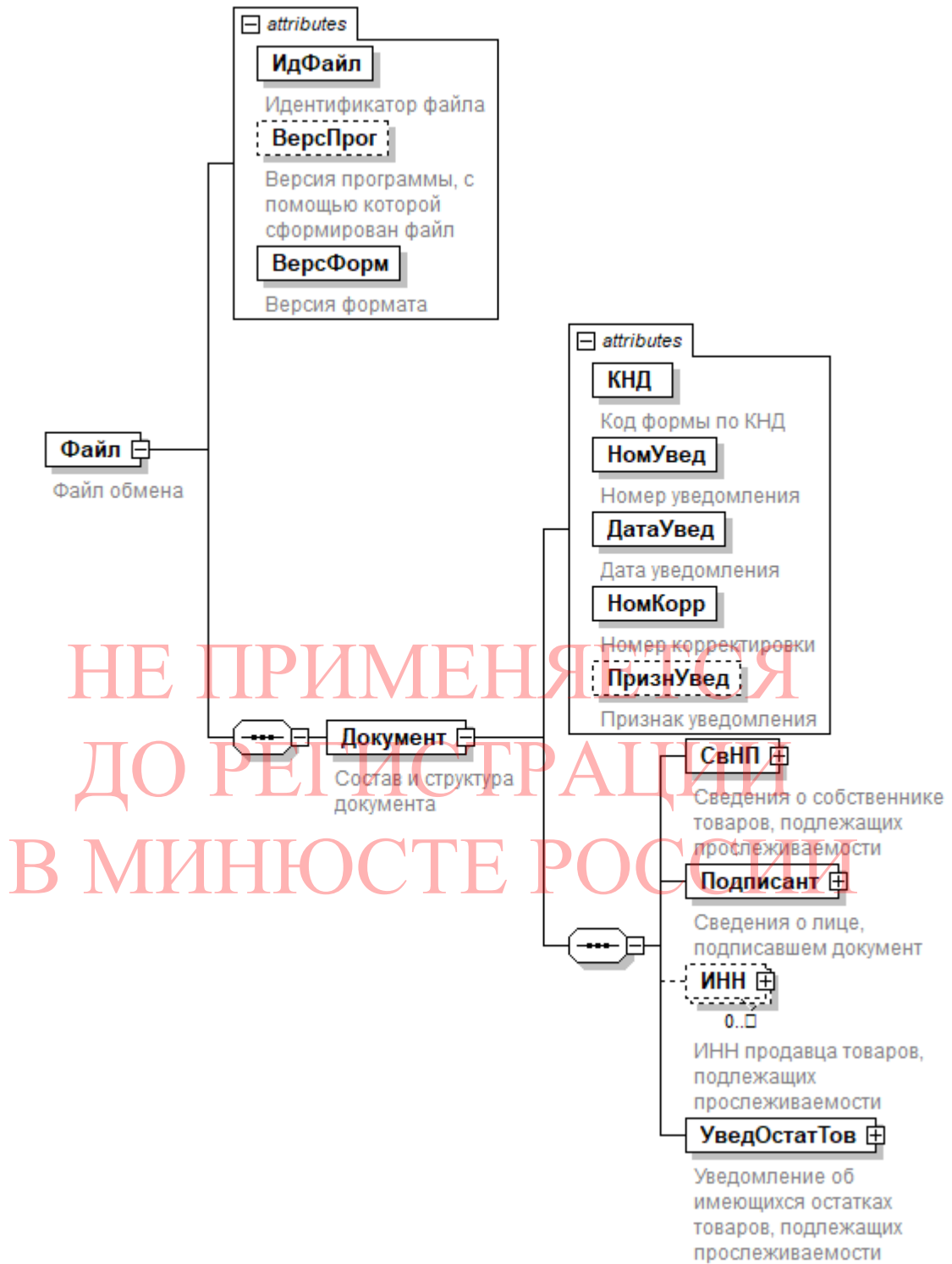
Рисунок 1. Диаграмма структуры файла обмена